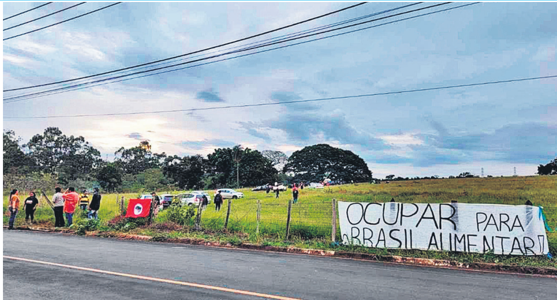
Jornada conhecida como 'Abril Vermelho' teve várias invasões no último fim de semana